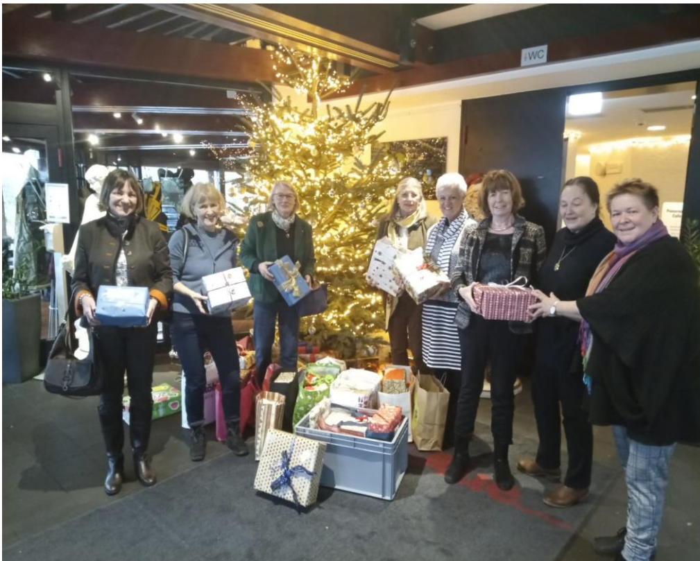
Die Spendenbereitschaft zu Weihnachten, war auch im Jahr 2023 ungebrochen