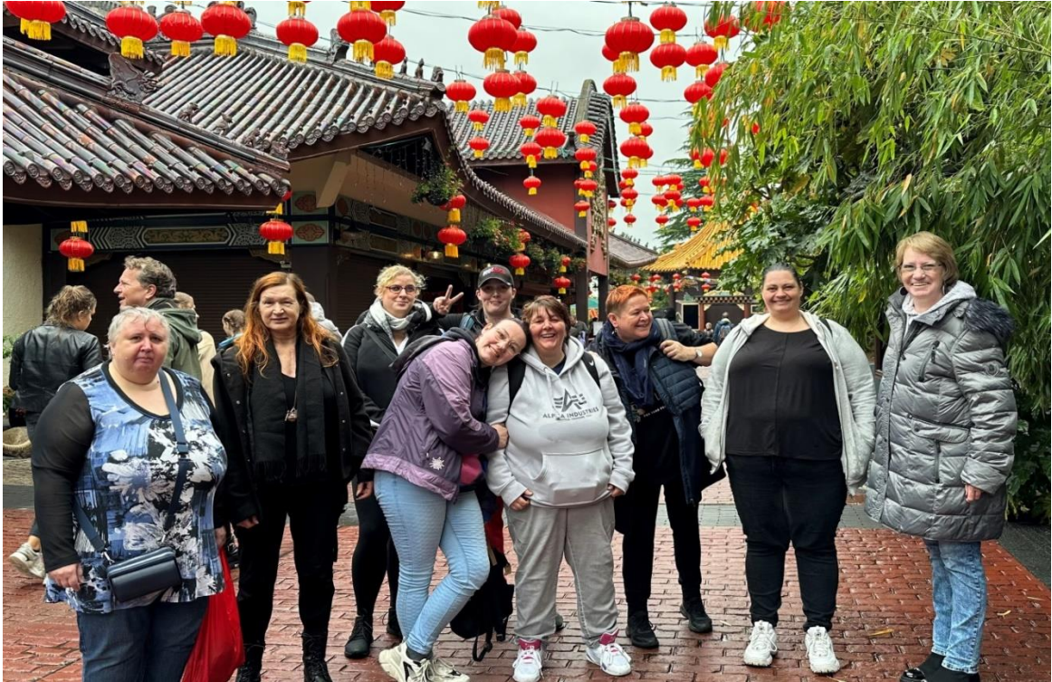
Team der tagesstrukturierenden Maßnahmen (Pforte 2023-Ausflug ins Phantasialand)