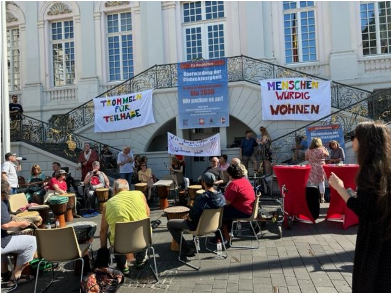
11.09.2023 Tag der Wohnungslosen